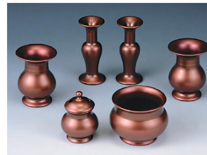
金物風仏具セット