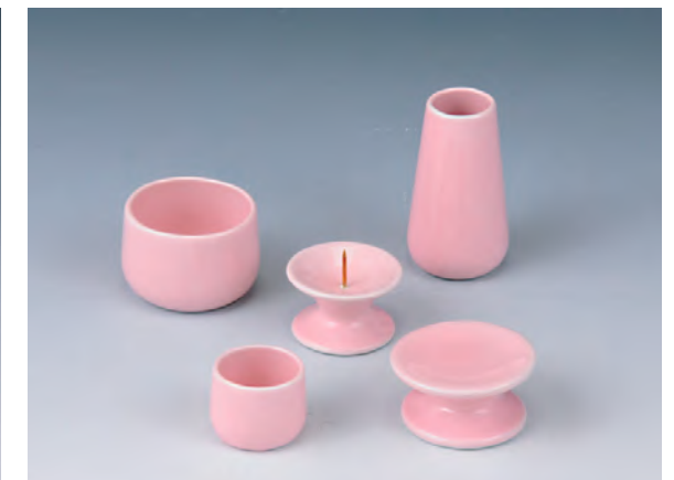
ペット用仏具セット