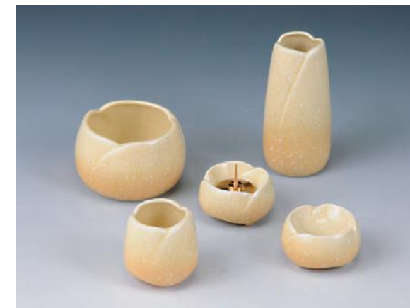
上置用仏具セット