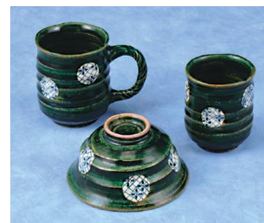
織部丸紋 茶碗 湯呑 マグ