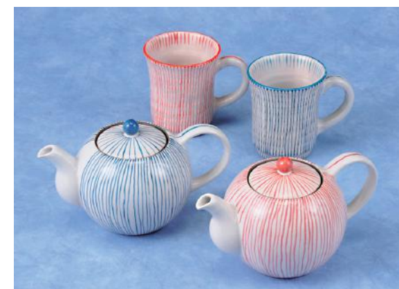
十草ポット (青) (赤)