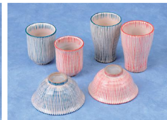
十草茶碗 湯呑 (青) (赤)