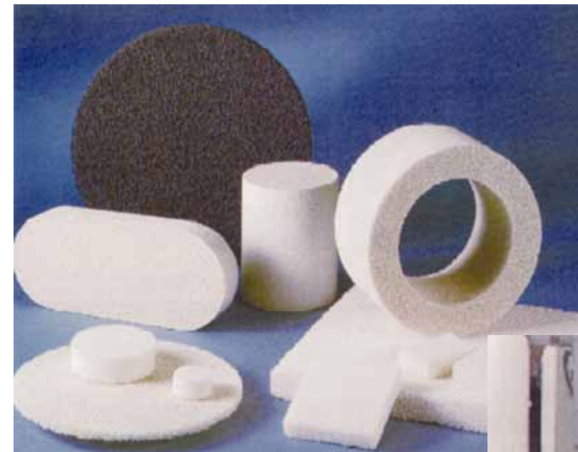
三次元網目構造 金属精錬用セラミックフィルター等